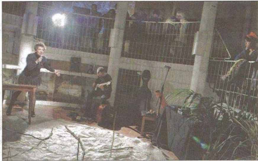
Soirée de poésie insolite et émotion partagée entre poètes, danseurs, musiciens et public dans le cadre de la 9 e édition des journées Poët Poët.

À l'étage du bas, dans le discret frémissement des insectes de l'écomusée, une douce musique nous emmène sur « La longue route » du poème de Patti