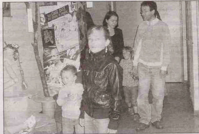
Un public ravi à la sortie du spectacle.